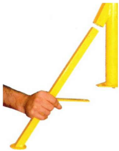
Pied de rechange (Adjust-A-Roll uniquement)