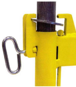
Rondelle de verrouillage améliorée