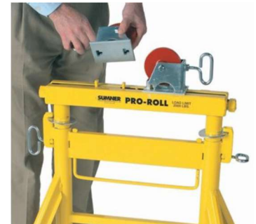
Changement rapide et sans outils des têtes optionnelles