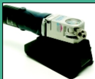
Support pour fixer la NEUTRIX à un banc.