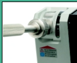
Angle de meulage réglable de 15-180° (angle inclus).