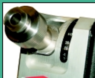
Le plat excentrique triple l'utilisation du disque diamant.