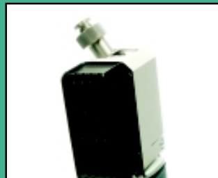
Un filtre remplaçable pour la poussière.