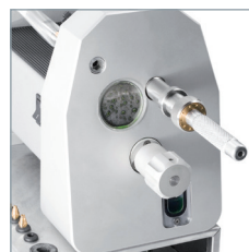
Coupez l'électrode en tournant la poignée