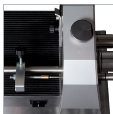
Déterminez la longueur de la coupe de l'électrode